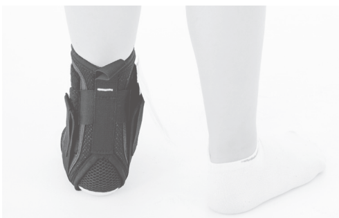
4. PL: Gotowy wyrób. EN: Product is ready to use.