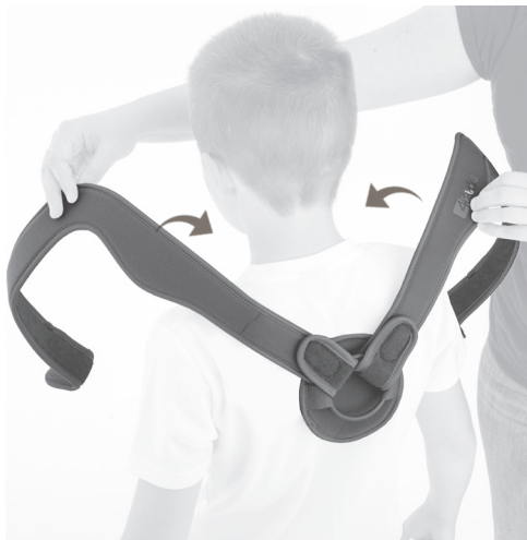
1. PL: Załóż ortezę na ramiona. EN: Place the brace on the shoulders.