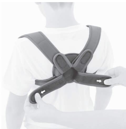
3. PL: Ustaw odpowiednią kompresję i zapnij rzepy. EN: Set the required level of compression.